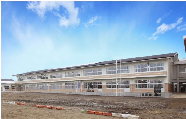
管理教室棟南側外観