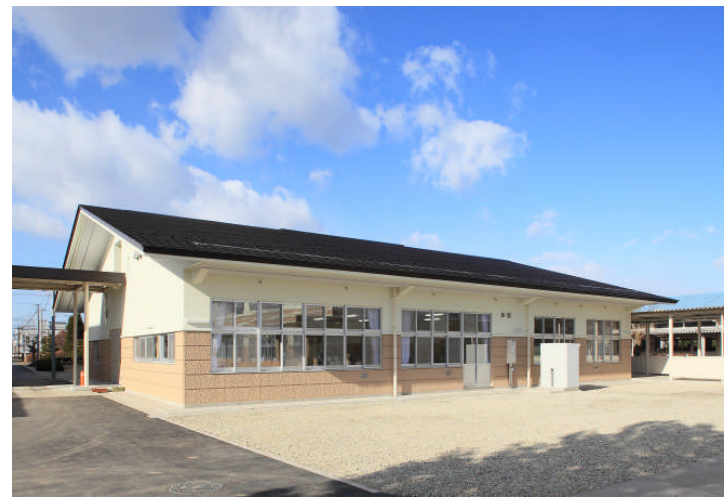
保健室棟南側外観