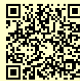
親学習プログラム アレンジ版

本リーフレット内容の詳しい説明や「親学習プログラムアレンジ版」は、上の二次元コードを読み取ると御覧いただけます。