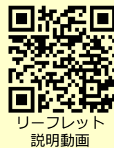
リーフレット 説明動画