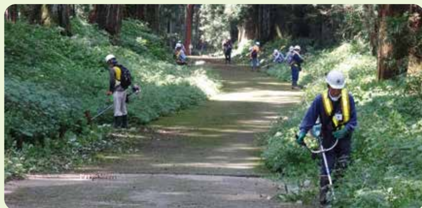
並木守ボランティアの活動風景

応募者の方全員に 「日光東照宮オリジナル 絵馬・カレンダー」を プレゼントします!!