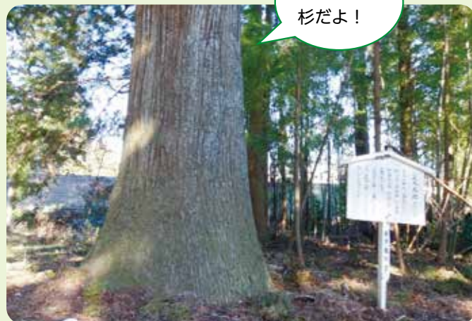
名物杉 並木太郎 (日光市七里)