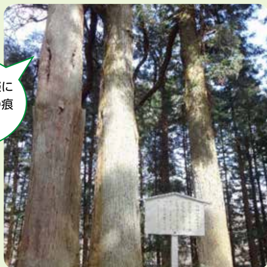
名物杉 砲弾打込杉 (日光市瀬川)