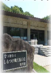
〈しもつけ風土記の丘資料館〉

こうした取組の拠点施設として活用されてきた「しもつけ風土記の丘資料館」が令和3年5月にリニューアルオープンしました。今回の改修では“子どもが楽しめる”をコンセプトに写真や図を多用し、当館オリジナルキャラクター『ハニワン』の案内で館内を巡ることができるようになりました。また、CGを多用した迫力の4K映像によって本市の歴史を学ぶことも可能です。地域を知り、地域の歴史を楽しく学ぶことができる施設として更なる連携や活用が期待されています。