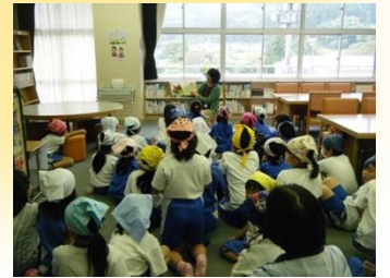
読み聞かせの一場面