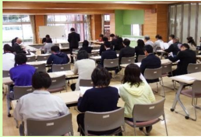
第1回阿久津小学校学校支援本部会議

10月6日に、第1回支援本部会議を開催し、支援本部会議の後、町教育委員会の社会教育主事が講演会とワークショップ「こんなボランティアさん、いたらいいな」「こんな地域教材、あったらいいな」を実施し、理解を深めました。