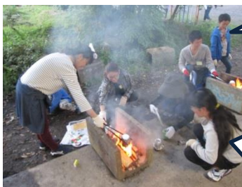
またまた空き缶登場！