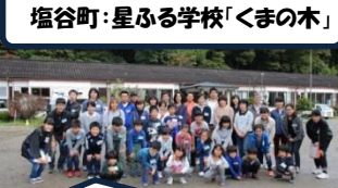
塩谷町・星ふる学校「くまの木」