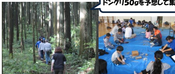
どんぐり150gを予想して集めたよ！