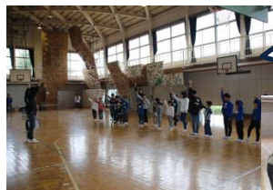
塩谷町ジュニアリーダーズの皆さんと