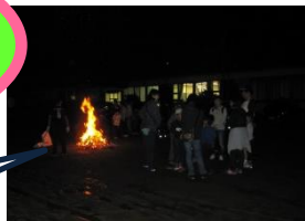
一日の楽しかったことを みんなでお話ししよう♪