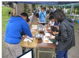
包丁を使って野菜を切ったよ！