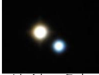
はくちょう座 アルビレオ (二重星)

天文館では、夏の星座観望会を開催します。夏の大三角からはくちょう座、こと座、わし座、南に下がってさそり座やいて座など、夏の星座を探します。