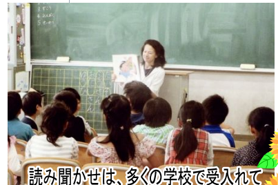
読み聞かせは、多くの学校で受入れている、学校支援ボランティアのひとつ。

※平成17年度 学校支援ボランティアに関する調査研究による (総合教育センター)