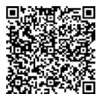
ふれあい講師派遣