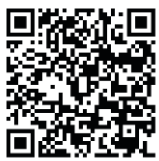
「成人を対象とした 人権教育～実践編～」