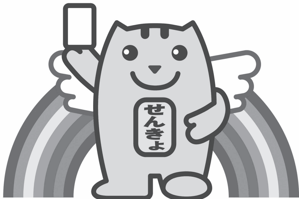
明るい選挙キャラクター 選挙のめいすいくん