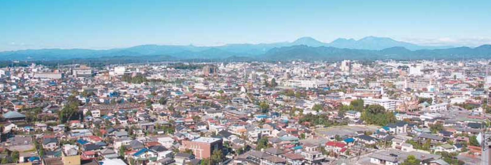
③ 展望ロビーの西側から日光連山をのぞむ