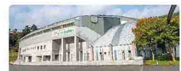
アイスアリーナ外観

アイスアリーナは、国際規格の本格的なスケートリンク。国民体育大会、日本学生氷上競技選手権大会などの国内大会はもちろん、ソチオリンピックアイスホッケー男子1次予選、世界女子アイスホッケー選手権大会デビジョン1など、国際大会も開催されています。アジアリーグアイスホッケーに加盟する「H.C.栃木日光アイスバックス」のホームリンクでもあるため、同チームとの練習試合も可能です。スケートセンターも同様に、数多くの大会を開催している国際競技規格の施設。2014年の国民体育大会の開催に合わせてリニューアルしました。