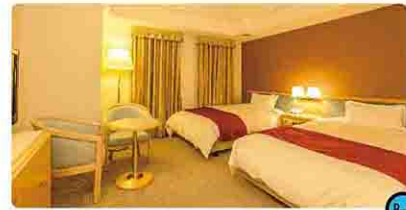
宇都宮東武ホテルグランド [宇都宮市]

宇都宮市の中心に位置し、県内各地へのアクセスに便利です。2012年にはアイスホッケーイギリス代表チーム約30名が、ソチ五輪に向けたキャンプの宿泊に利用しました。