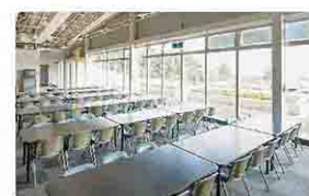
カフェレストラン