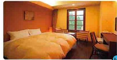
日光ステーションホテル [日光市]

JR日光駅前に建つ格式高いモダンクラシック調のホテル。気品が溢れ落ち着いた客室です。