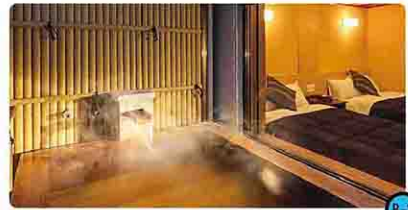
鬼怒川温泉あさや [日光市]

創業明治21年の温泉宿の和風情緒を楽しむことができます。全ての客室の浴室に温泉が引かれています。