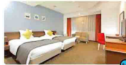
ホテルマイステイズ宇都宮 [宇都宮市]

宇都宮駅から徒歩約3分という好立地で栃木県内各所へのアクセスに優れています。H.C. 栃木日光アイスバックス対戦チームの宿泊利用実績があります。