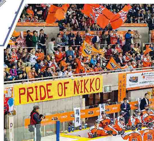
H.C. 栃木日光アイスバックスは日本唯一のプロチーム。毎試合数多くのファンが応援に駆けつけています。