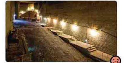
大谷資料館 [宇都宮市]

宇都宮市大谷町で採掘される独特の質感を持つ大谷石。その地下採掘場跡は、深さ30mに2万平方メートルもの巨大な空間となっており、地下の巨大建造物のような幻想的な雰囲気を醸し出しています。採掘の歴史や採掘方法、運搬方法などの資料も展示しています。