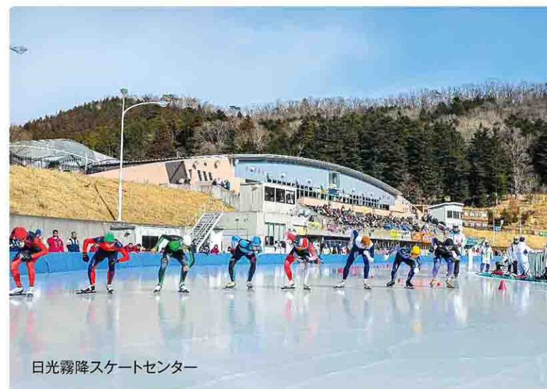
日光霧降スケートセンター