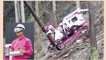
<遠隔操作機械の活用等によるスマート林業の推進>