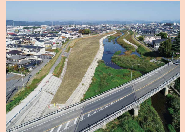
<防災・減災のための河川整備>