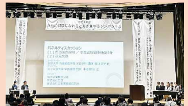
<自然に健康になれるとちぎ食の環シンポジウム>