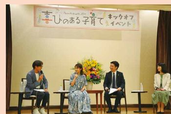
<「喜びのある子育て」推進キャンペーン キックオフイベント>