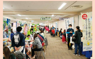
<移住・定住イベント>