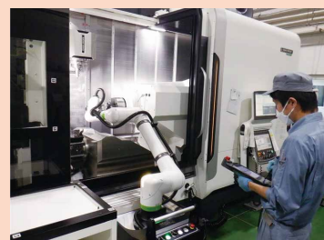
<切削加工現場におけるロボットの活用>