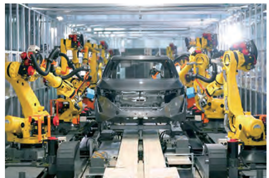
▲ Chế tạo ô tô