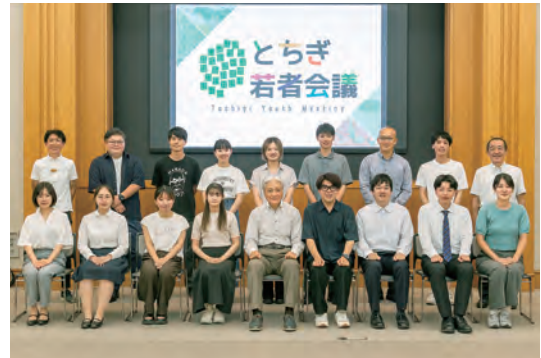
▲ Hội nghị Thanh niên Tochigi