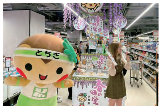
▲ Hoạt động thử nghiệm thị trường tại Hồng Kông