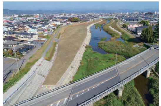
▲ Nâng cấp hệ thống sông ngòi phục vụ công tác phòng chống và giảm thiểu thiên tai