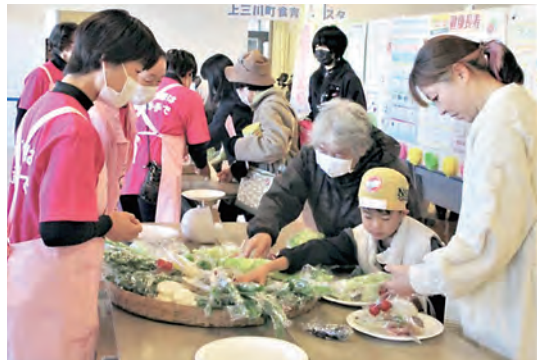
▲ Sự kiện nâng cao sức khỏe cộng đồng