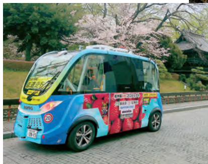
▲ Thí nghiệm kiểm chứng xe buýt tự lái