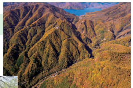
▲ Đèo Irohazaka và hồ Chuzenji

6 Quản lý điều hành chính quyền địa phương