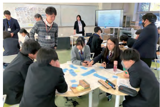
▲ Học tập liên môn, xuyên lĩnh vực