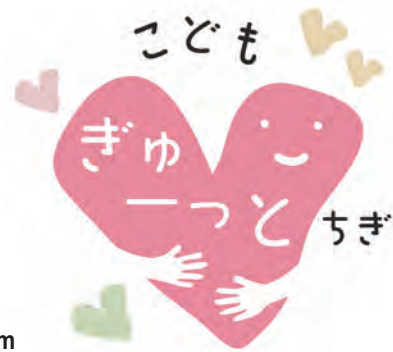
▲ Khẩu hiệu PR và logo tuyên truyền “Tỉnh Tochigi thân thiện với trẻ em và gia đình”