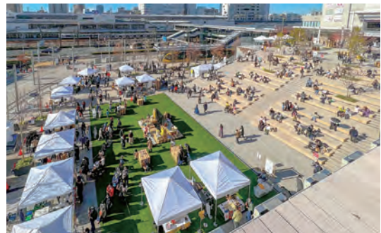
▲ Xây dựng đô thị đậm đà bản sắc riêng