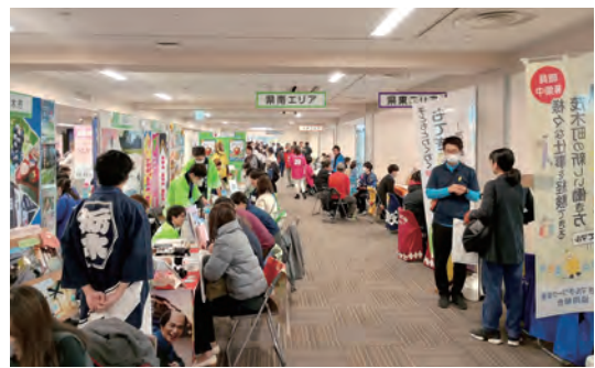
▲ Sự kiện xúc tiến di cư và định cư lâu dài