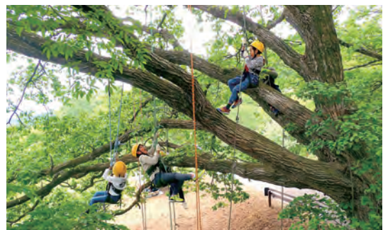
▲ Hoạt động trải nghiệm và gắn kết với thiên nhiên