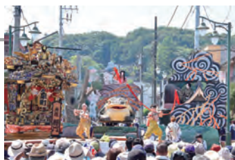
▲ Lễ hội Yamaage ở Karasuyama