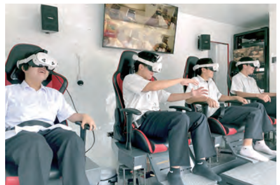
▲ Trải nghiệm nâng cao ý thức phòng chống thiên tai thông qua ứng dụng công nghệ thực tế ảo VR