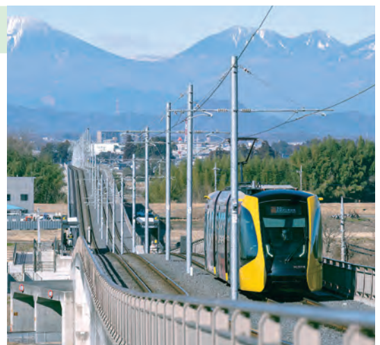
▲ Vùng đất hài hoà giữa đời sống, kinh tế và thiên nhiên