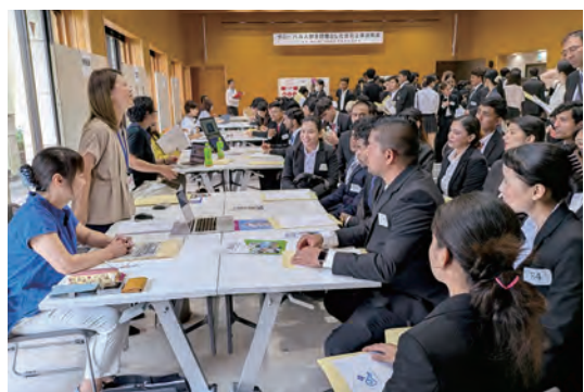
▲ Hội thảo giới thiệu doanh nghiệp dành cho nguồn nhân lực nước ngoài v.v