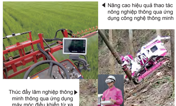
◀ Nâng cao hiệu quả thao tác nông nghiệp thông qua ứng dụng công nghệ thông minh