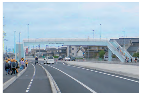
▲ Xây dựng cầu vượt cho người đi bộ và via hè trên đường đến trường