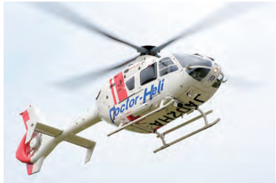
▲ Trực thăng cấp cứu