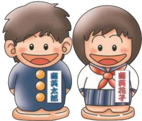
【栃木県東京学生寮】