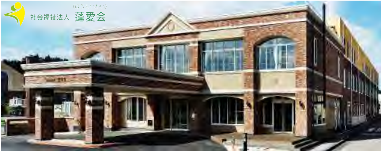
(ほうあいかい) 社会福祉法人 蓬愛会