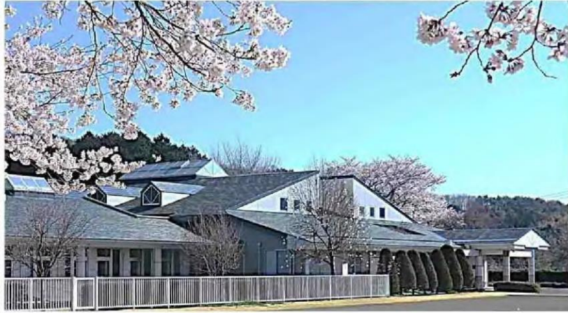
特別養護老人ホーム ききょうの里