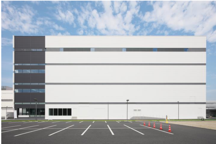
さらなる海外増産体制を見込んだ新製造棟が完成（2025年竣工）