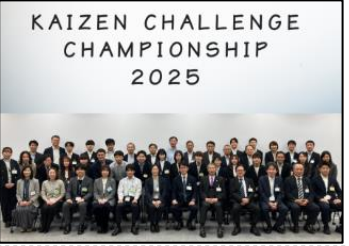
↑シミックCMO株式会社 足利工場

改善発表会→ 毎年各拠点から様々なアイデアが集結し、品質・安全など継続的な改善活動を大切にしています。