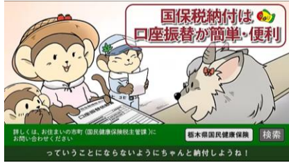
国保納付は口座振替が簡単・便利