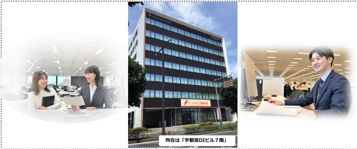
所在は「宇都宮DIビル7階」