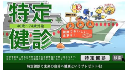
特定健診で未来の自分へ健康というプレゼントを！