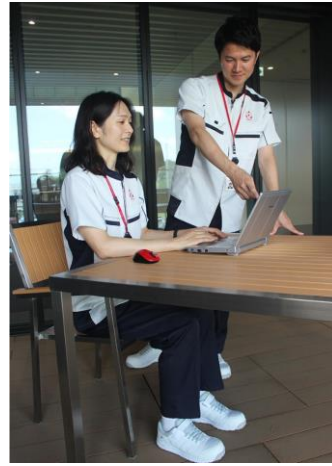
オープンなコミュニケーション