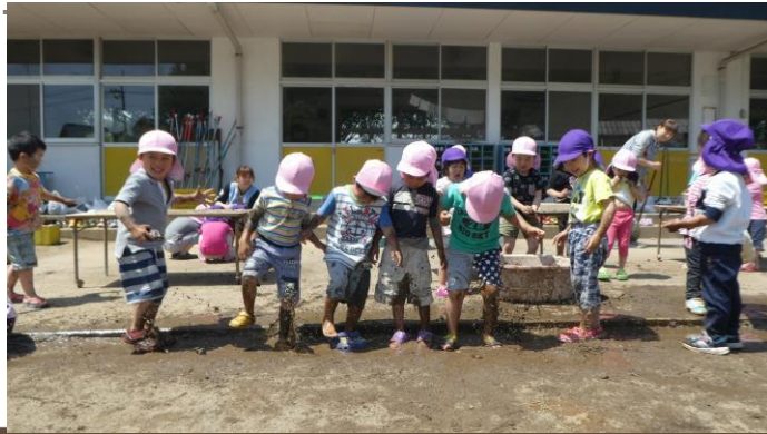
幼保連携型認定こども園