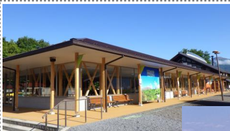
道の駅友愛の森 農産物直売所新築工事