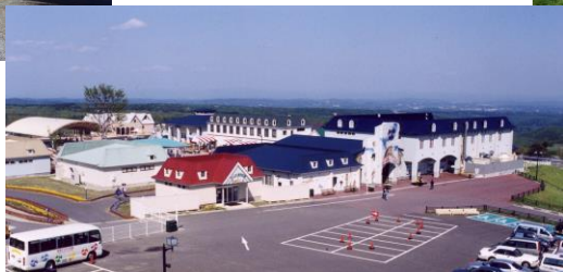
那須どうぶつ王国