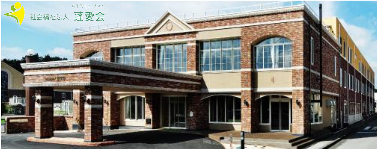
(ほうあいかい) 社会福祉法人 蓬愛会