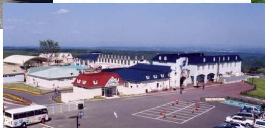
那須どうぶつ王国