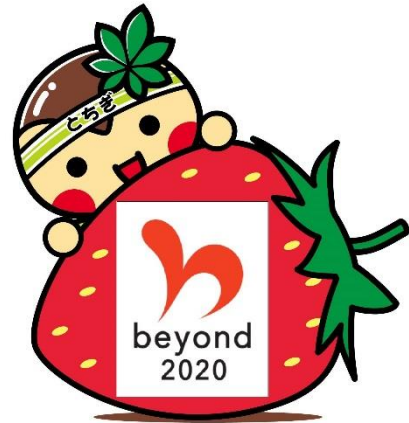
<いちごバージョン>

キャラクターと一体型のロゴマークは「全国初」！ 栃木県マスコットキャラクター「とちまるくん」とのコラボ