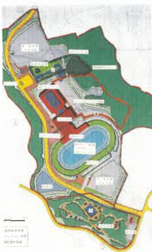
〈アイススケート施設整備構想図〉

首都圏の秘境にふさわしい自然とのふれあいの中で、オールシーズン型のリゾート地形成のため、4kmダウンヒルの「スキー場」、「乗馬クラブ」、「テニスコート」、「ペンション」などの整備を図る計画です。