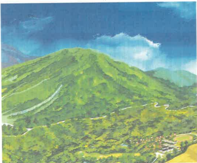
鶏頂高原スポーツリゾート整備イメージ図

これらの特性を生かして、幅広い年齢層に対応できるオールシーズン型リゾート地をめざし、「樹の博物館」、「童話の森」、「スキー場(ハンターマウンテン・スキーボウル塩原)」、