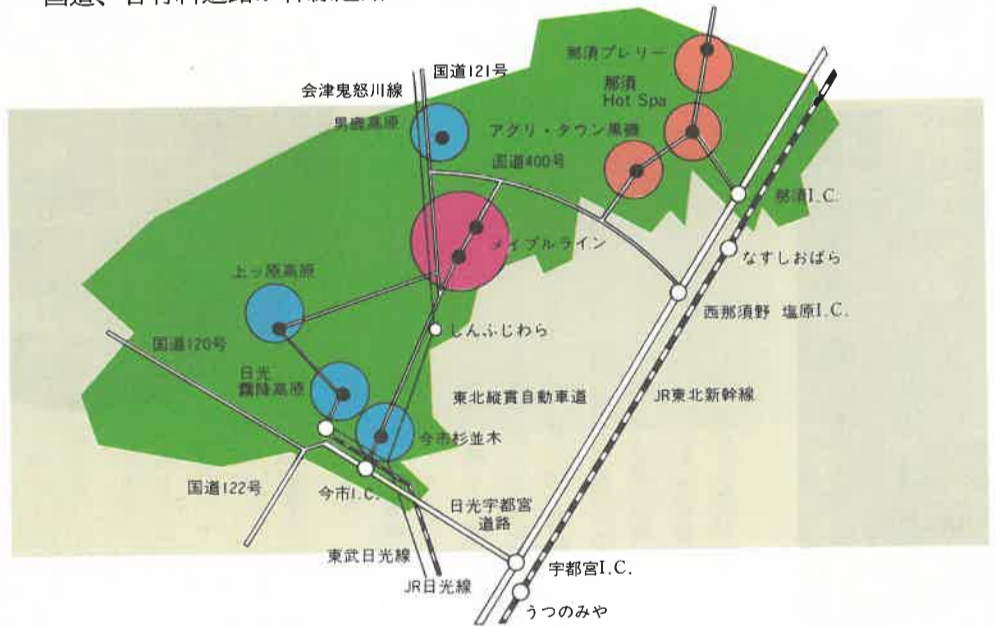
〈重点整備地区相互間の距離及び所要時間〉

「日光・那須リゾートライン」は、思ったつたらずぐ行ける時間・距離です。東北新幹線をはじめとするJR各線、東武鉄道、会津鬼怒川線などの鉄道や、駅から運行されるバス、そして、東北縦貫自動車道、日光宇都宮道路や主要国道、各有料道路が幹線道路として結ばれています。