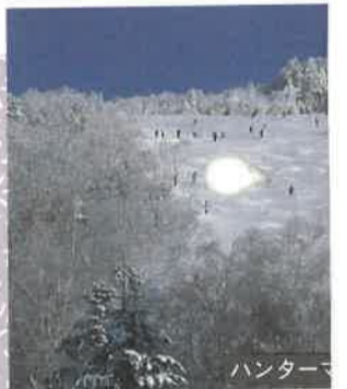
「学習観察村」、「ペンションビレッジ」、「パードウォッチングの森」などの整備を図る計画です。