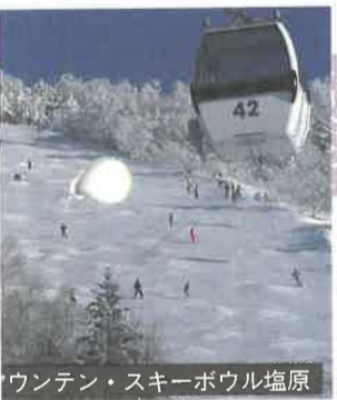
ワンテン・スキーボウル塩原

尾崎紅葉、夏目漱石ら文人達の創作活動の場でも知られる温泉観光地、そして優れた自然環境の広葉樹林をもつ森林は、心身をリフレッシュさせてくれます。