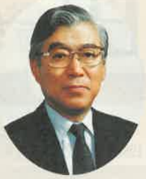
栃木県知事 渡辺 文雄

本県の「日光・那須リゾートライン構想」は、昨年10月に国の承認を受けました。対象地域は、那須町、黒磯市、塩原町、藤原町、栗山村、今市市及び日光市の七市町村のうち約17万ヘクタールの地域で、その中に、特に整備を促進するための地区として、八つの重点整備地区を決定しました。 この八つの重点整備地区が、互いに連携をもつ質の高い一大リゾート地域となるよう、地域のほぼ中央にあるメイプルライン重点整備地区を「センターゾーン」、那須プレリー、那須Hot Spa、アグリ・タウン黒磯の各重点整備地区を「那須ウイング」、男鹿高原、上ツ原高原、今市杉並木及び日光霧降高原の各重点整備地区を「日光ウイング」と位置づけ整備を進めています。