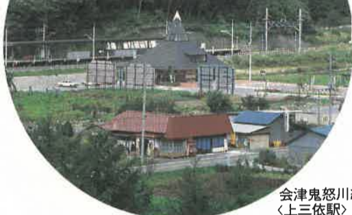
津鬼怒川線(上三依駅)

この自然を生かし、上級者向け「スキー場」を整備して本格的スキーリゾート地として、また、四季を通じて楽しめるように「多目的競技場」、さらに、ふるさと村型リゾート地の形成のため「ふるさと味覚センター」、「特産物加工センター」などの整備を図る計画です。