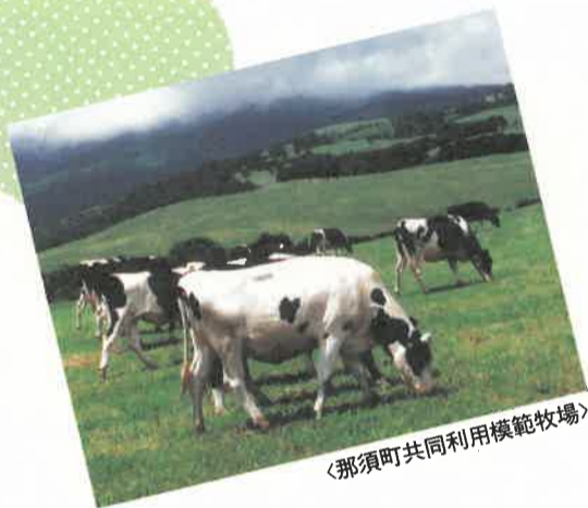
那須町共同利用模範牧場

日常では味わえない自然の姿を体験できる「動物ふれあい広場」、「畜産パイオ館」、「動物学習舎」、「畜産加工場」、「ロープウエー」、「クラフト村」、「グラススキー場」、「スキー場」などの整備を図る計画です。