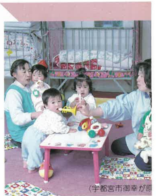
〈宇都宮市御幸が原〉

●『児童福祉週間』におけるイベント 児童福祉週間(5月5日～11日)に、講演会やパネル展示をおこない、PRを図った。