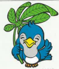
「県民の日」マスコット「ルリちゃん」

▶7回目を迎えた今年も、真岡市を中心に記念行事「悠・優もおか'92」を開催します。 ▶問合せ 県民の日実行委員会事務局 (☎0286-23-2157)