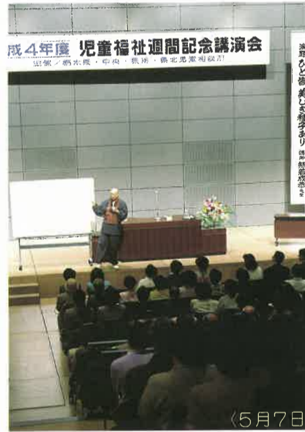
〈5月7日 総合文化センターにて開催〉

どうか県民のみなさまには、それぞれの立場から、児童育成へのより一層のご理解とご協力をお願い申し上げます。