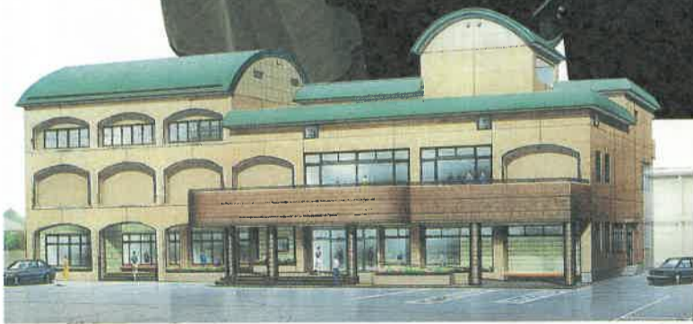
とちぎ青少年センター (宇都宮市)