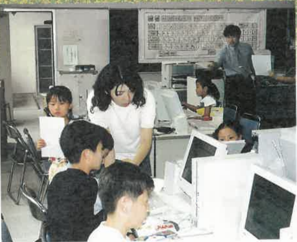
小学校でのチーム・ティーチングの授業

図るため、行政のコンピュータネットワーク化（電子県庁）を進めます。また、県民がITに関する基礎的な技能を習得するための講習会などを実施します。