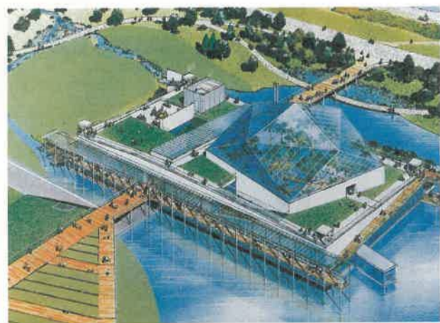
なかがわ水遊園 (湯津上村)