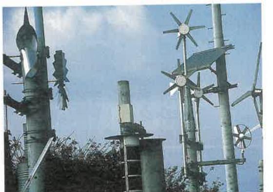
新エネルギーの導入(写真は足利工業大学・風の広場)