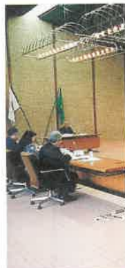
3月23日に開かれた行