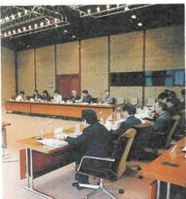
政改革推進委員会