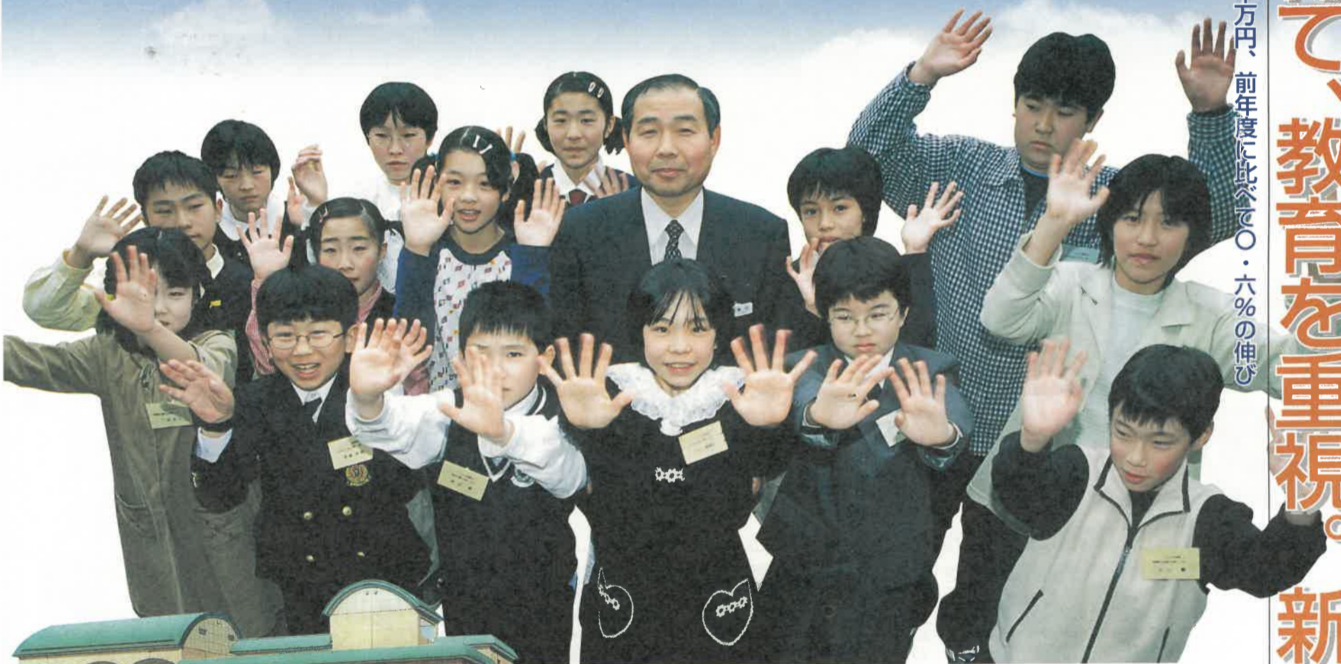
福田知事とジュニア知事さんたち