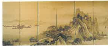
特別企画 室町・江戸の屏風絵から