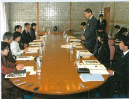
「とちぎ元気づくり会議」のようす

とちぎの新たな活力の創出に向けて、県は、「とちぎ元気づくり会議」を設置しました。これは、各分野の有識者の方々と知事が、県政全般にわたる諸課題について意見交換を行う場として設けられたものです。二月十九日には、県公館で初めての会議が行われ、委員の方々から、さまざまな意見をいただきました。