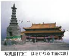
写真展「円仁 はるかなる中国の旅」

●テーマ展①「祈りの風景～栃木の年中行事」②「おじいさんやおばあさんの子どものころの暮らし」③「初公開!けんぱく自然史資料」●3/31(土)まで●写真展「円仁 はるかなる中国の旅」●2/21(水)まで●県総合文化センター(宇都宮市)●午前10時～午後6時(最終日は午後3時まで)●入場無料●博物館ボランティア募集中●詳細は問合せを