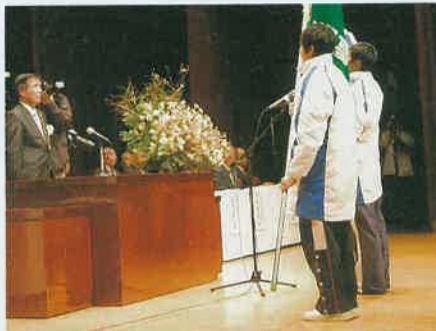
日光総合会館で行われた開会式のようす