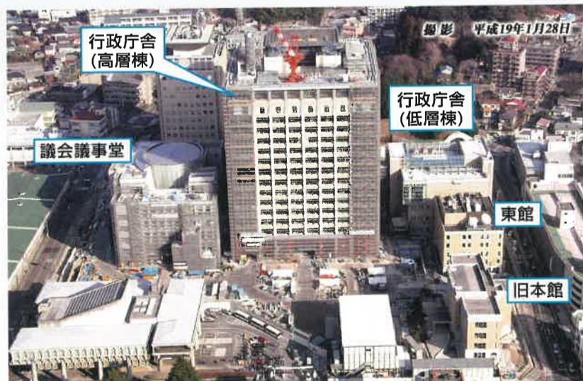
県庁舎の工事は、県のホームページで見ることができます。ぜひご覧ください。 ホームページアドレス http://www.pref.tochigi.jp/chosya/jyoukyou/jyoukyou.htm

平成16年10月から始まった新県庁舎の建設は、2年4か月経過し、全体の約8割が完了しました。いよいよ工事も最終段階を迎え、新議会議事堂は本年4月から、新行政庁舎は平成20年1月からの使用開始となります。