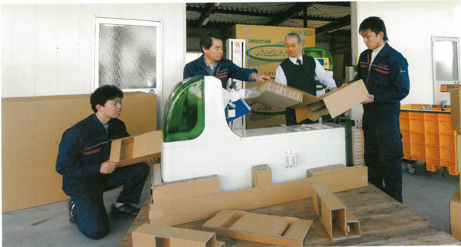
メンターとともに、製品の梱包について検討する(株)タイガーカワシマ(藤岡町)の皆さん。同社は、主に米麦用小型農業機械の開発から製造販売までを一貫して行っている企業です

◎問合せ (財)栃木県産業振興センター ☎028-670-2601 HP http://www.tochigi-iin.or.jp/