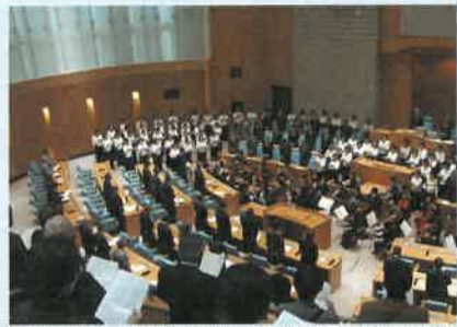
見学に訪れた県民の皆さんも、栃木県交響楽団の演奏に合わせて斉唱しました

四月十七日、県農業大学校において「とちぎ農業未来塾」の開校式が行われた。この塾は、Uターン就農や定年帰農など新たな就農希望者へ知識や技術の習得の場を提供することを目的に開設された。研修には、新規就農と定年帰農の二つがあり、今回は、新規就農希望者研修の受講生五十九名が式に参列。二十代から六十代までの幅広い年代の方々が一年間、研修にはげます。