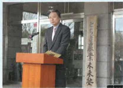
「持てる能力を発揮して夢の実現とともに県農業の未来を切り開いていって下さい」と激励の言葉を贈る福田知事