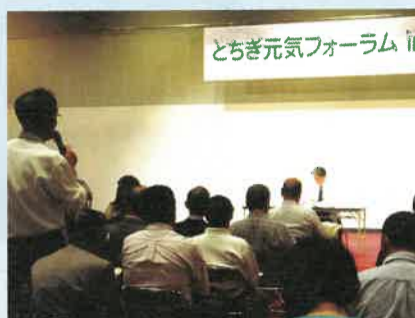
とちぎ元気フォーラム ただいま7月開催分の参加者を募集中です。詳しくは3面のお知らせをご覧ください

五月十六日、宇都宮市にあるジョブカフェとちぎ内に「とちぎ若者サポートステーション」がオープンしました。ここは、若者の就労を、主にメンタル面で支援するところ。臨床心理士による「こころの健康サポート」のほか、夜間の電話相談や家庭訪問などを行います。また、自然体験や職場めぐりツアーなどのイベントも開催しますので、お気軽にお越しください。