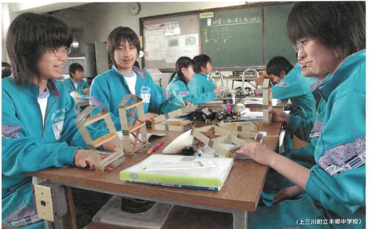
「建物に補強があると揺れが小さくて済むことがわかったね」

〒320-8501 宇都宮市鳩田1-1-20 TEL 028-623-2192 FAX 028-623-2160 栃木県のホームページ http://www.pref.tochigi.jp/