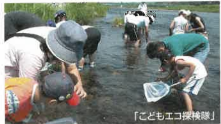
「子どもエコ探検隊」

「子どもエコ探検隊」参加者募集 ●水生生物の観察を体験しよう●対象 小学生とその保護者●参加無料●定員 各コース先着20組●申込期間 7/2(月)～20(金) ◎県北コース 8/4(土)午前8時30分～午後4時●なかがわ水遊園(大田原市) ◎県南コース 8/5(日)午前8時30分～午後4時●出流ふれあいの森(栃木市) ■県保健環境センター☎028-673-9070