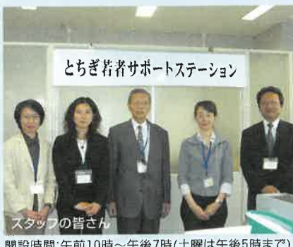
とちぎ若者サポートステーション スタッフの皆さん 開設時間：午前10時～午後7時(土曜は午後5時まで) カウンセリング等は予約が必要です ☎028-823-3223

五月十六日、宇都宮市にあるジョブカフェとちぎ内に「とちぎ若者サポートステーション」がオープンしました。ここは、若者の就労を、主にメンタル面で支援するところ。臨床心理士による「こころの健康サポート」のほか、夜間の電話相談や家庭訪問などを行います。また、自然体験や職場めぐりツアーなどのイベントも開催しますので、お気軽にお越しください。