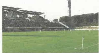
メイン・サブグラウンドともに照明設備があり、午後9時まで利用することができます

宇都宮市清原工業団地32 ☎ 028-667-0962 栃木SCのホームスタジアム。サッカーのほかラグビーなどの試合や練習に利用できます。