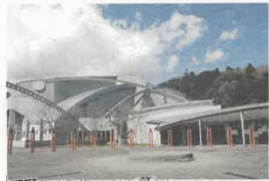
帽子と手袋を忘れずに

日光市所野2854先 ☎ 0288-53-5881 HC日光アイスバックスのホームリンク。全国でも数少ない真夏にスケートが楽しめる所です。