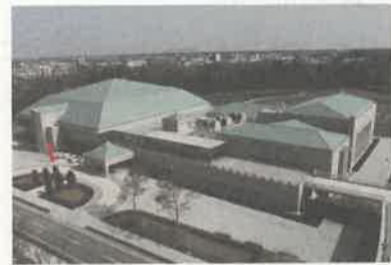
となりには県立温水プール館もあります

小山市外城371-1 ☎ 0285-21-0021 リンク栃木ブレックスの試合会場になっています。剣道場、柔道場、トレーニング室、幼児体育室を完備。