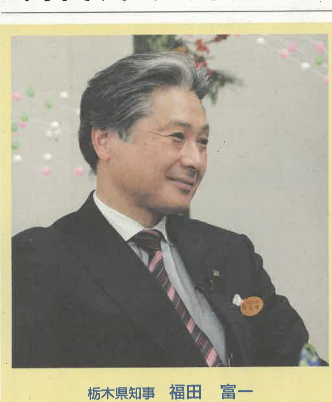
栃木県知事 福田 富一