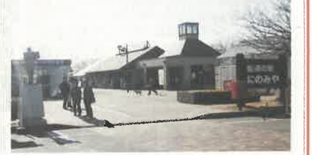
いちごの香りに包まれた道の駅

いちごの生産県内一の真岡市にある道の駅にのみや。物産館では、いちごをはじめ新鮮な野菜や特産品が販売されています。人気のあるいちごのジェラートや手作りパン、品揃え豊富ないちご関連商品も好評です。駅構内には「いちご情報館」があり、いちごの歴史や生産などの情報が映像や3D画像で学べるほか、展示温室では、本県に関わりのあるいちご栽培展示されています。