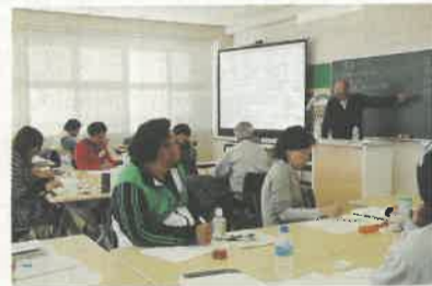
受講者は男性16名、女性4名の計20名。経営内容も野菜、水稲、花き、酪農とさまざま

県では、昨年10月、経営の高度化を目指す農業者を対象にした「とちぎ農業ビジネススクール」を県農業大学校に開校しました。