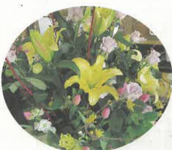
フラワー装飾技能士の資格を生かしフラワーアレンジメントなど販売面でも強みが

「ユリの品種ごとに種苗費、栽培期間や定植密度など、生産や販売の履歴を記録しています。このデータをもとに綿密な栽培計画を行い、経費管理や危機管理をしています」