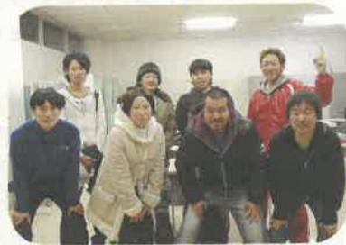
さまざまな経営知識を得て、考え方の幅が広がりました。人脈も広がります