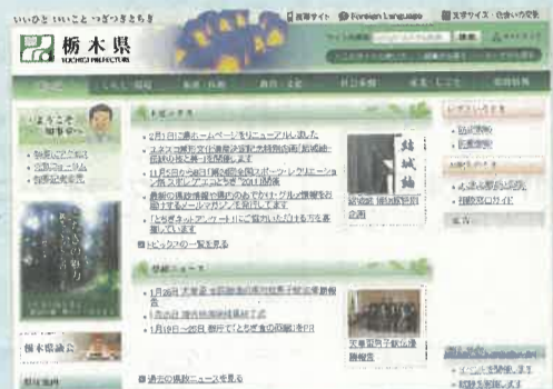
緑を基調とした落ち着いたデザイン