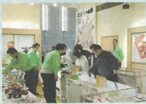
首都圏の「食」のオアシスとちぎをPR