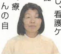
大田原赤十字訪問看護ステーション 宮崎所長