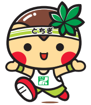
スポレク“エコとちぎ”2011 マスコット「とちまるくん」

編集・発行 栃木県広報課 平成23年10月2日発行 毎月第1日曜日発行(次回は11/6発行) 〒320-8501 宇都宮市埴田1-1-20 TEL 028-623-2192 FAX 028-623-2160 栃木県のホームページ http://www.pref.tochigi.lg.jp/