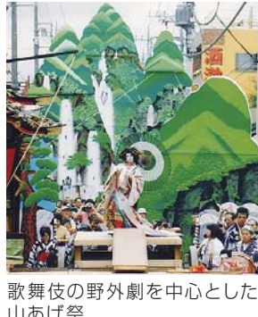
歌舞伎の野外劇を中心とした山あげ祭

5日(土)・6日(日)には県総合運動公園で、全国からの参加者と県民との出会いやふれあいの場として、特別行事が実施されます。交流ステージでは、5日(土)午後3時から、栃木弁