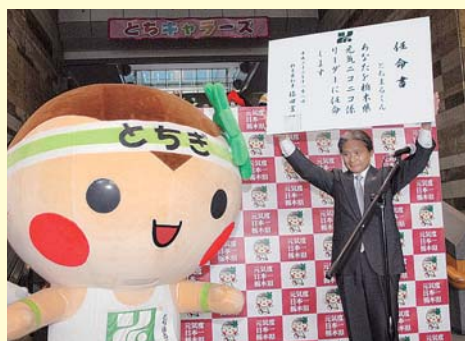
福田知事からとちまるくん任命書が渡されました