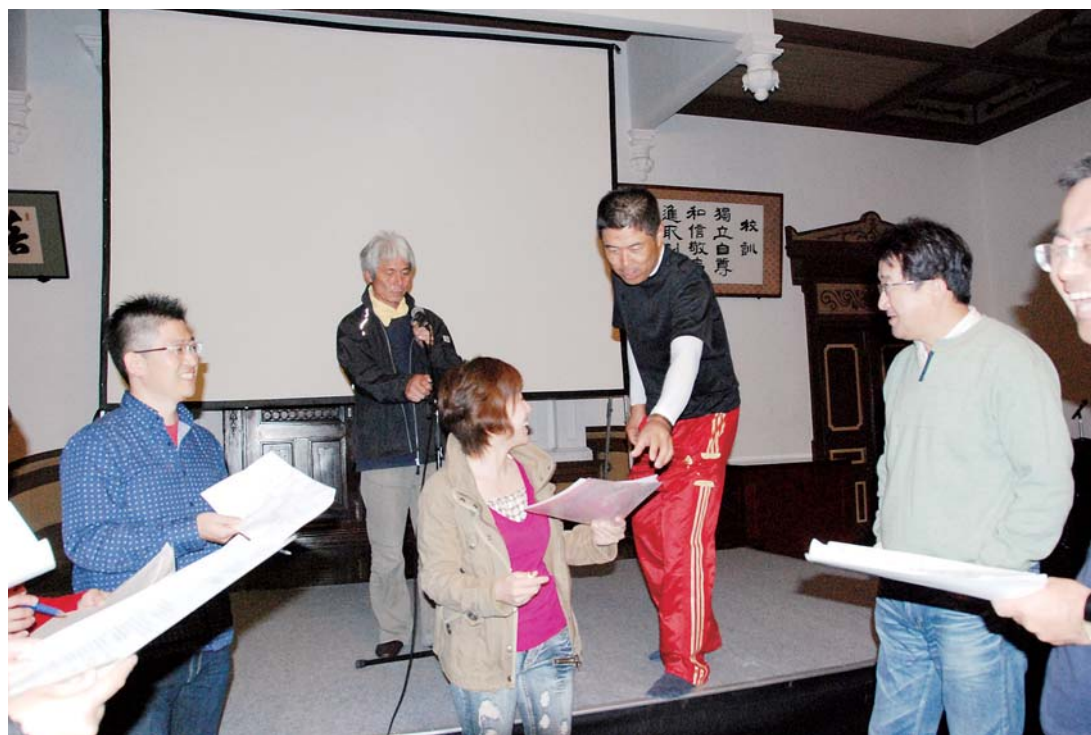
「街を盛り上げたい」みんなの思いは一つ／県立栃木高校講堂(国指定有形文化財)で映画祭リハーサル

きっかけは、「蔵の街ならではのイベントで街を元気に盛り上げたい」という市民の声。志を同じくする市民、ボランティア、NPO、企業、行政の協働により映画祭をつくり上げています。「市民や学生ボランティアもたくさん協力してくれています。市民や団体、企業、行政がお互いを知り、理解する良い機会にもなっています」