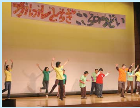
軽快なダンスを披露

今年も、とちぎ福祉プラザで「栃木県障害者文化祭(カルフルとちぎ2011)」が開催されました。合唱や合奏のほか、ダンスの発表なども行われ、会場は多くの人でにぎわいました。絵画や書道などの作品展示のほか、カラオケ大会も行われ、参加者は日頃の練習の成果を発揮し、自慢の歌声を披露していました。