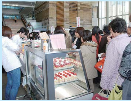
いちごのショートケーキを買い求める人ににぎわいました

今年も、とちぎ福祉プラザで「栃木県障害者文化祭(カルフルとちぎ2011)」が開催されました。合唱や合奏のほか、ダンスの発表なども行われ、会場は多くの人でにぎわいました。絵画や書道などの作品展示のほか、カラオケ大会も行われ、参加者は日頃の練習の成果を発揮し、自慢の歌声を披露していました。