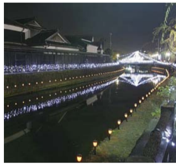
イルミネーションで彩られた巴波川

あしががフラワーパーク フラワーファンタジー光の花の庭(1月22日まで開催) 高さ23メートルの巨大なクリスマスツリーや、水辺に浮かぶ光のピラミッドなど、大小さまざまなイルミネーションが、来場者の視線を釘付けにします。闇に浮かび上がる電飾150万球の光景は圧巻です。