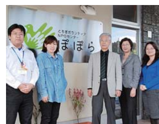
専門のスタッフがお待ちしています