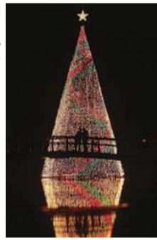
高さ23mの巨大なツリー

とちぎで過ごすクリスマス なかがわ水遊園 「サンタの水中散歩」(12月25日まで開催) アマゾン大水槽の中にサ