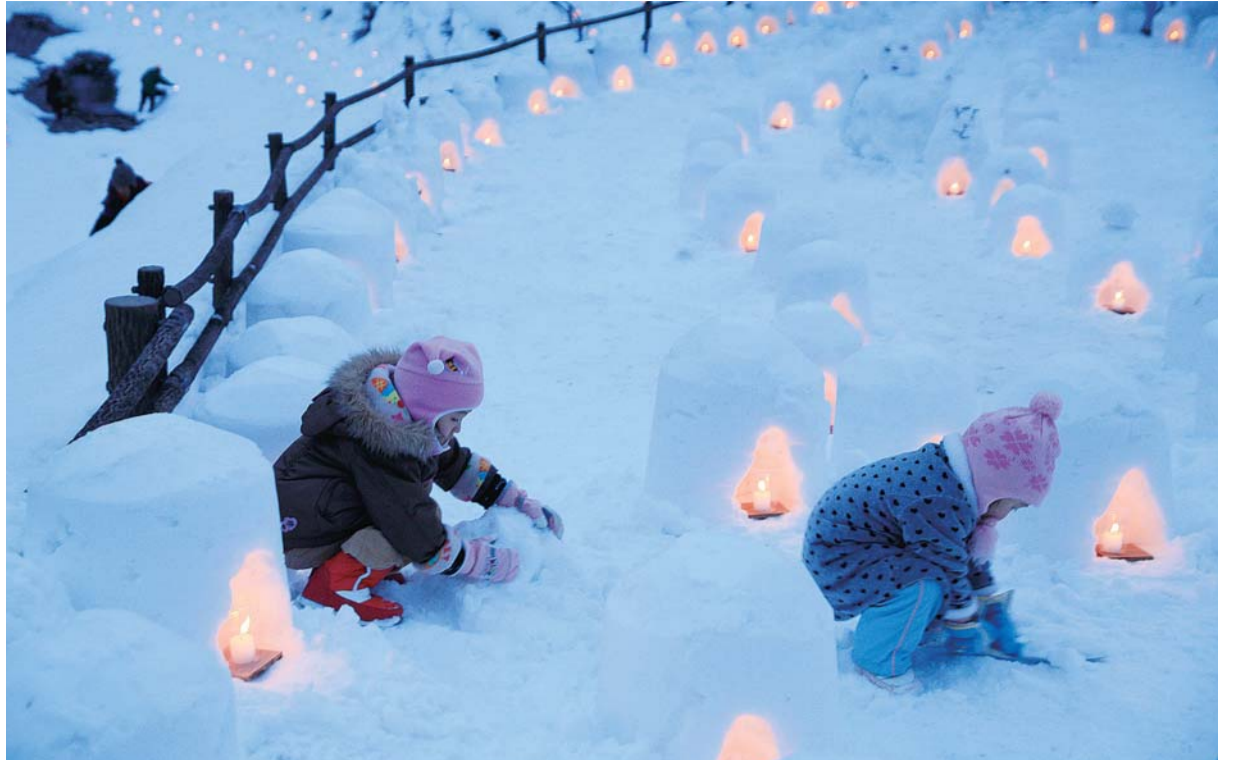
ライトアップされたミニかまくら／湯西川温泉かまくら祭(日光市)

〒320-8501 宇都宮市堀田1-1-20 TEL 028-623-2192 FAX 028-623-2160 栃木県のホームページ http://www.pref.tochigi.lg.jp/