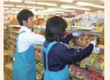
企業での実習の様子

各特別支援学校には進路指導担当教員がおり、生徒が企業等での実習を通して働くことの大切さを学び、主体的に進路を選択することができるよう、きめ細かな指導を行っています。また、就労支援員を配置し、進路指導担当教員と連携して実習・就職先企業の開拓に取り組んでいます。