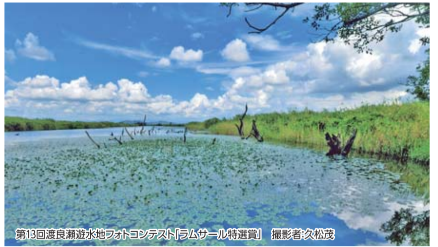
第13回渡良瀬遊水地フォトコンテスト「ラムサール特選賞」

本県には「奥日光の湿原」と「渡良瀬遊水地」という、2カ所のラムサール条約登録湿地があります。この夏は豊かな自然とふれあって、さまざまな生き物たちのかけがえのないすみかである湿地の大切さなどについて考えてみませんか。