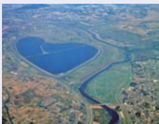
上空から見た渡良瀬遊水地

栃木市の南部を中心に群馬県・茨城県・埼玉県の一部に広がる3,300haの大遊水地です。昔から度々大規模な水害に見舞われていたこの地域は、明治43年から大正11年にかけて遊水地として整備されました。また、用地の取得に当たっては谷中村を廃村にするなど、地域の人々の大きな犠牲があったことも忘れてはいけません。