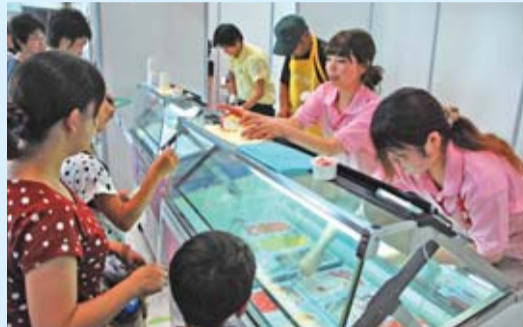
色とりどりのジェラートが並びました

ジェラートコーナーでは、定番のいちごや個性派のとうもろこしなど、県産の多彩な農産物を使った58種類を食べ比べできるとあって、お目当てのジェラートを求める人で、長い行列が出来ました。