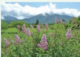
戦場ヶ原に咲くホザキシモツケ

戦場ヶ原だけでもホザキシモツケなど100種類以上の湿原性植物の生育が確認されているほか、オオジシギ、ノビタキなどの湿地帯に生息する鳥類の繁殖地にもなっています。