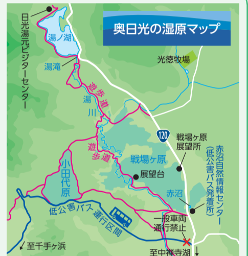
奥日光の湿原マップ

また、奥日光の一部の道路では一般車両の乗り入れを規制しています。代替交通として運行している環境にやさしい低公害バスの利用をお願いします。