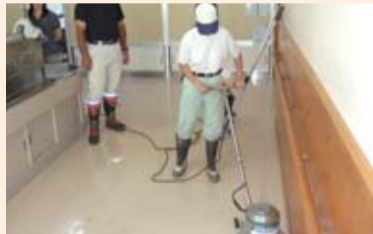
業務用ポリッシャーを使っての実習