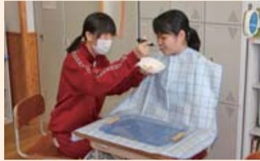
食事の介護の実習

平成23年度から専門教科「福祉」を導入し、今年度は全校で取り組んでいます。校内の実習では、生徒が介護する側と介護を受ける側を交代したり、介護用マットレスや車椅子などを使用したりし、社会福祉に関する基礎的・基本的な知識や技術を身に付けます。このほか、高齢者福祉施設等での実習も行い、実践的な能力を育てます。