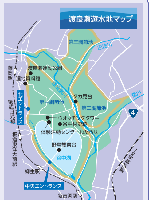
渡良瀬遊水地マップ

渡良瀬遊水地で行われるイベントや利用の方法などの情報は、渡良瀬遊水地アクリメーション振興財団のホームページをご覧ください。