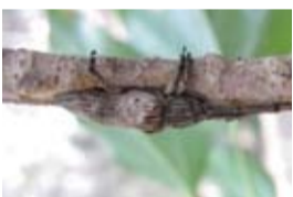
タテジマカミキリ

☎028-634-1311 ●月曜日(祝日を除く)、祝日の翌日 ◎テーマ展「秋の虫・冬の虫」 ●1/26(日)まで ●昆虫は夏だけでなく、秋も冬も楽しむことができます。これからは冬の昆虫シーズン。この季節特有の、あまり見慣れない昆虫をたくさん紹介します