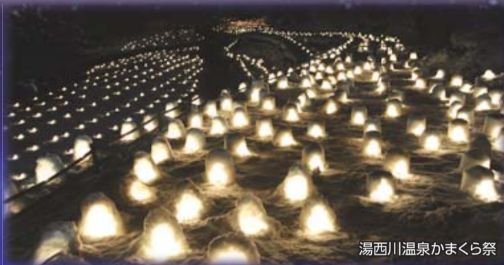
湯西川温泉かまくら祭

冬のとちぎも魅力が盛りだくさん! 11月29日から来年3月2日まで、「やすらぎの栃木路」冬の観光キャンペーンを実施しています。この冬のお出掛けは、県内でお得に楽しみませんか。