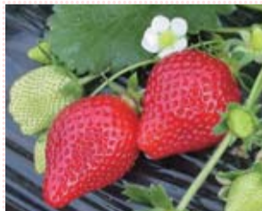
大粒で皮が柔らかく、口いっぱいに果汁が広がるとちひめ。事前予約の上、お出かけください。

いちご狩りは、おおむね5月ごろまで楽しむことができます。一足早い春を迎えた暖かいハウスで日本一のとちぎのいちごを味わいに、家族や友人と一緒に、出かけてみてはいかがでしょうか。県外の方を案内して、とちぎのいちごをPRするのもいいですね。