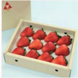
見た目と味に優れたプレミアム商品

「女峰」や「とちおとめ」など、優れたいちごの品種を開発・生産してきた本県から、新しいいちご「スカイベリー」が誕生しました。スカイベリーは“大粒できれいな円すい形”、“甘みと酸味のバランスが良く、ジューシーでまろやかな味わい”などの優れた特徴を持つ、いちご王国とちぎの新たなスターとなる高級いちごです。