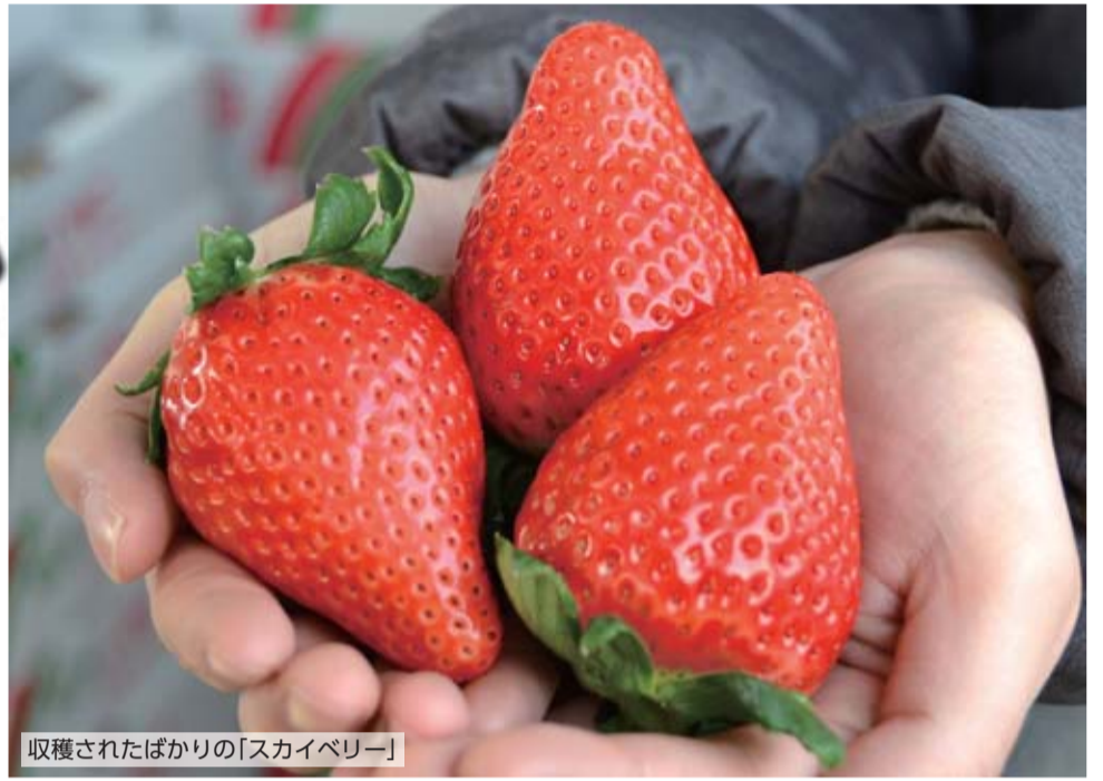
収穫されたばかりの「スカイベリー」

甘くておいしくビタミンCも豊富で、子どもから大人まで大人気のいちご。本県は、冬季の豊富な日照量や肥沃な大地、清らかな水に恵まれ、いちごの収穫量45年連続日本一を誇る“いちご王国”です。