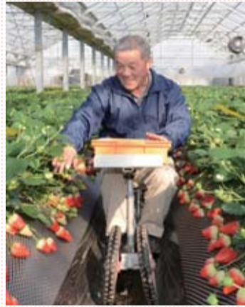
真っ赤に完熟した実だけを選んで収穫します