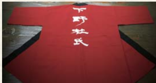
「下野杜氏」だけが羽織ることのできる法被

平成18年度の発足後、これまでに認定されたのは22人。「下野杜氏」になるためには厳しい試験やカリキュラムが課されており、筆記・実技・面接試験だけでなく、酒造技術者養成講座で講師を務めることも要件となっています。地元の若い蔵人たちは、とちぎの地酒づくりを担う後継者として、勤め先の酒蔵の枠を越え、互いに切磋琢磨しながら酒造技術と品質の向上を目指しています。