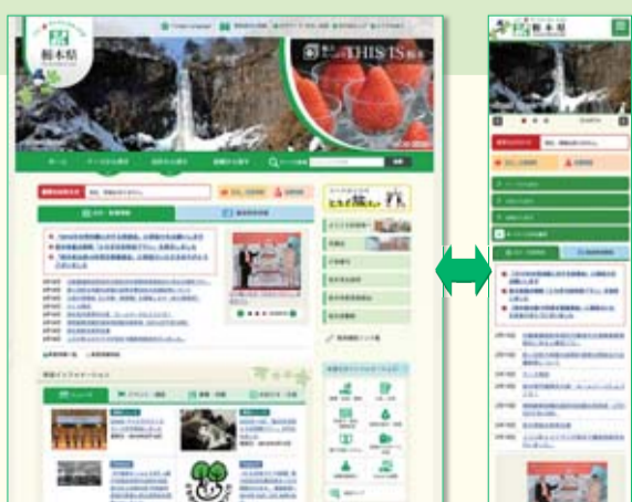
パソコン版 スマホ版