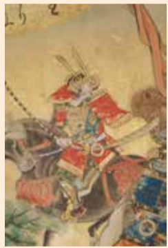
「太平記絵巻」巻二から「宇都宮公綱」埼玉県立歴史と民俗の博物館蔵

会期: 10/29(日)まで(休10/10(火)) 問 同館(宇都宮市) ☎028-634-1312