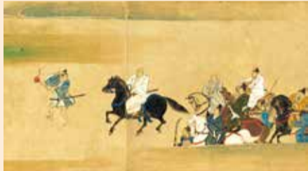
国宝「法然上人絵伝」巻四二から「嘉禄の法難(宇都宮頼綱)」知恩院蔵

宇都宮氏は、宇都宮明神(現在の宇都宮二荒山神社)の神職を務める一方で、武勇に優れた勇猛な武士団でした。特に、九代当主である公綱は、鎌倉幕府が滅亡に至る一連の動乱において、幕府方として楠木正成と戦いましたが、その戦いぶりは「太平記」において「坂東一の弓矢取り」と評されているほどです。