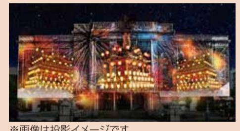
※画像は投影イメージです

時間 午後5時～(21日は午後4時30分～) ※プロジェクトマップの投影:午後5時30分～、6時～、6時30分～、7時～、7時30分～(全5回) 場所 県庁