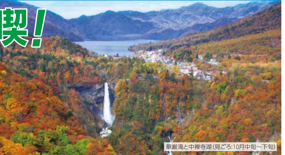
華厳滝と中禅寺湖(見ごろ:10月中旬~下旬)