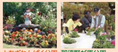
とちぎわんぱく公園 那須野が原公園 (壬生町) (那須塩原市) ☎0282-86-5855 ☎0287-36-1220

県営都市公園5会場で行われる緑化イベントです。 ●会場を色とりどりの花で飾り付け！ ●「寄せ植え」などの体験講座 ●草花即売会 ●木の実や花を使ったクラフト教室 ●フリーマーケット ●パフォーマンスショー ●ガーデニングコンテスト作品展示 など