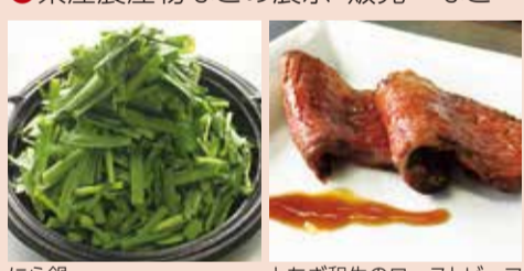
にら鍋 とちぎ和牛のローストビーフ ※写真はいずれもイメージです 問 県農村振興課 ☎028-623-2333 または とちぎふれあいフェア2017 検索

時間 午前10時～午後4時 場所 県庁 栃木県の農業・農村の魅力を感じることができる“食と農”の祭典。県内各地のおいしい農産物や、それらを使用した“本物の味”を見つけに来てみませんか。 ●栃木県のブランド米3品種の食べ比べ ●にらをたっぷり盛った「にら鍋」の販売 ●とちぎ和牛、にっこり(梨)など、栃木県のブランド農産物を使用した料理の販売 ●県産農産物などの展示・販売 など