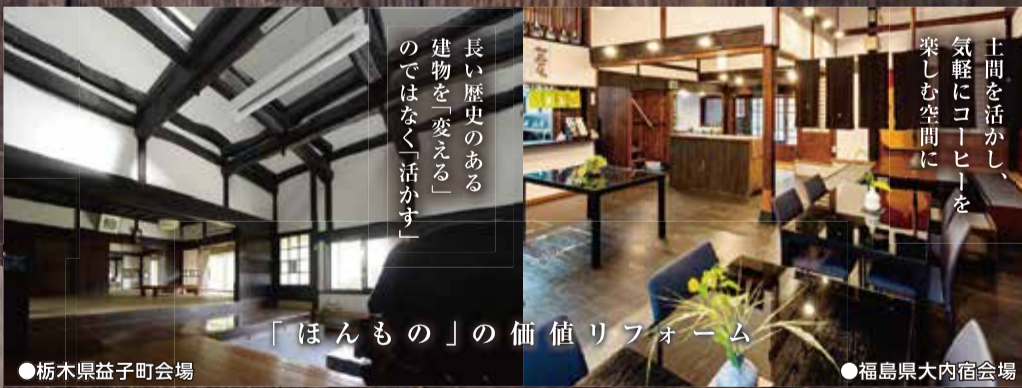
●栃木県益子町会場

※ご自宅から集合・解散場所までの交通費は自己負担となります。参加条件 百年のいえ倶楽部(入会金・年会費無料)にご入会の方または、お申し込み済みの方(参加希望者多数の場合は、抽選となります。)