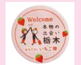
おもてなしいちご隊缶バッジ