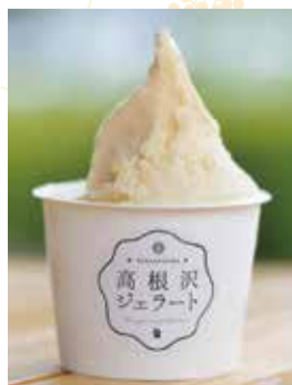
にっこり梨のカスタードパイ仕立て