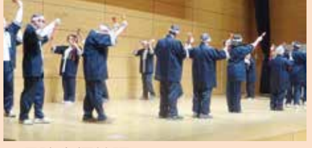
問 県障害福祉課 ☎028-623-3490 FAX 028-623-3052