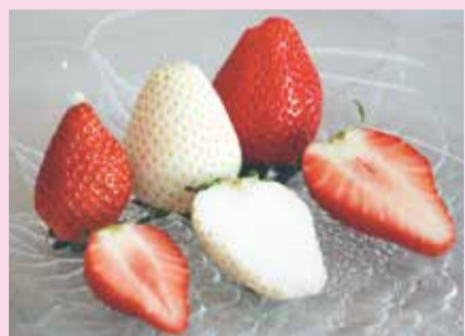
左から、とちおとめ、新品種「栃木iW1号」、スカイベリー。真っ白で大粒の果実が特徴

今年の秋には、ブランド名が決定される予定。観光いちご園での摘み取りや、スカイベリーと紅白でセットにしたお祝い用の贈答品など、いろいろな場面での活用が期待されています。2020年の年末頃から一般販売ができるよう、生産体制を整えていきます。「いちご王国・栃木」の新たないちご。もうしばらくお待ちください!