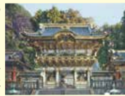
日光東照宮 陽明門

この「日光」の地名が影響したという説もあるのが、1617(元和3)年に徳川家が建立し、後に世界遺産となる日光東照宮です。家康の遺言に基づき、江戸の真北で江戸を守る位置とされた日光がその建立地として選ばれたのは有名な話ですが、一説では地名の縁起の良さも、この地に招き寄せる一因になったとも言われています。もし「日光」という地名になっていなかったら、これほど世界に誇れる観光地にはなっていなかったかもしれませんね。