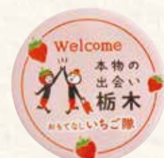
おもてなしいちご隊缶バッジ

問 おもてなしいちご隊運営事務局(県観光物産協会内) ☎028-623-3213