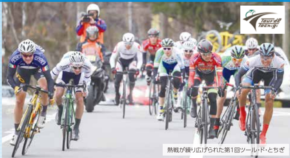
熱戦が繰り広げられた第1回ツール・ド・とちぎ

栃木県内の全市町を舞台とする、全国で初めてのサイクルロードレース「ツール・ド・とちぎ」の第2回大会が、今月23日から3日間開催されます。国内外から出場する世界トップクラスのチーム・選手の熱い戦いを、ぜひ生で観戦し、そのスピードや迫力を感じてみてください。