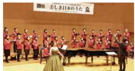
問 県県民文化課 ☎028-623-2153

●文化活動やその担い手の育成などの費用の一部を助成します ●文化活動等助成事業 ●対象：地域づくりや文化芸術活動、その担い手の育成を行う事業 ●助成額：助成対象経費の2分の1以内(上限50万円) ●地域伝統文化継承事業 ●対象：用具・衣装の修理など、地域伝統文化の普及・継承に必要な事業 ●助成額：助成対象経費の10分の4以内(上限50万円) ●ローカルプロジェクトモデル事業 ●対象：ジャンルや地域の枠を超えた連携などにより、地域の取り組みをけん引するモデル事業 ●助成額：助成対象経費の3分の2以内(上限100万円) ※いずれも 3/30(金) ●詳しくは問い合わせを