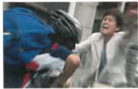
無灯火・携帯電話使用時の事故例