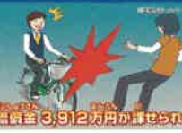
不注意運転による事故例