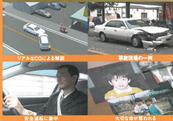
リアルなCGによる解説

どんなに運転が「たくみ」でもそれだけで事故は防げません。 ハンドルを握る「こころ」のあり方が安全運転の決め手なのです。