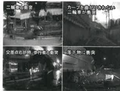
ドライブレコーダーの映像より