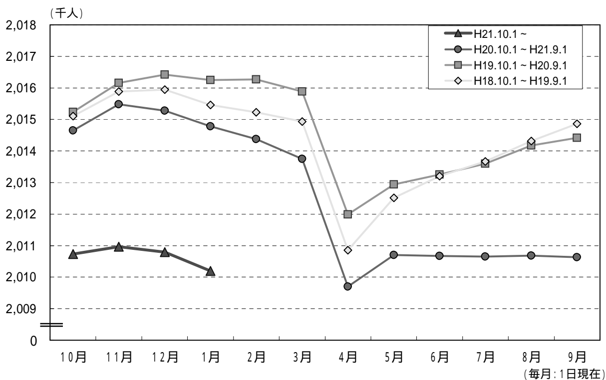
図2 自然・社会動態の推移 (平成19年12月中～平成21年12月中)