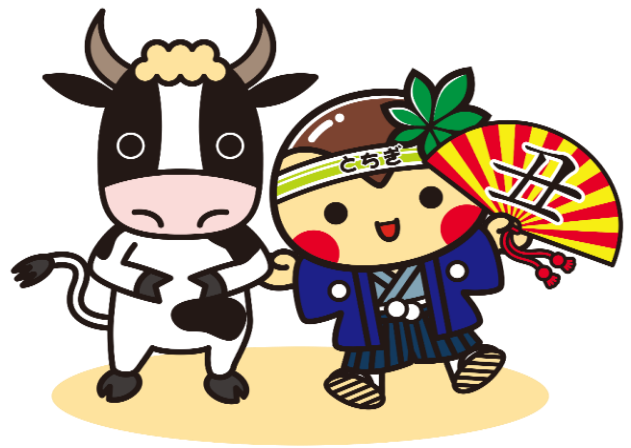
表1 丑年生まれの人口