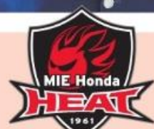
三重ホンダヒート