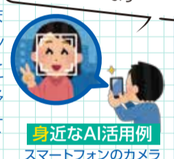
身近なAI活用例 スマートフォンのカメラ