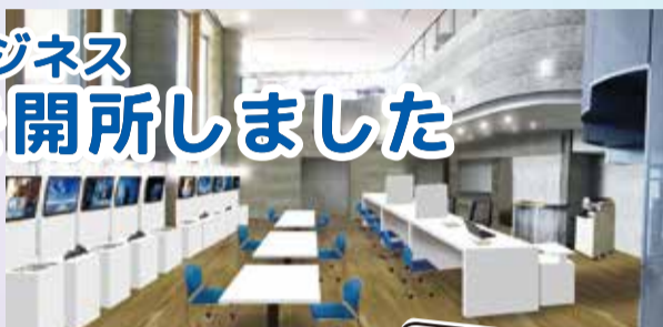
センター内の様子

5月31日、とちぎ産業創造プラザ(宇都宮市)内に、「とちぎビジネスAIセンター」を開所しました。今回は、センターの概要についてご紹介します。