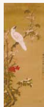
ただなが しょうきんず 戸田忠翰「梅に小禽図」1787年(同館蔵)→

開館以来40年近くにわたり収蔵してきた210件もの美術資料はどのような資料か、さらにそれらはどのような経緯で収蔵庫にあるのか、美術の歴史からはちょっと逸れた裏話のような展覧会を開催します。