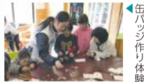
缶バッジ作り体験