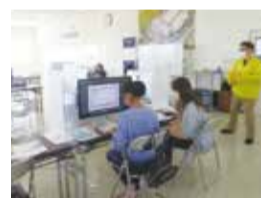
自分の名刺を作成してみよう!/ (株)ダイサン