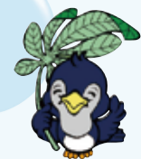
県民の日マスコット「ルリちゃん」

「県民の日」は、明治6(1873)年6月15日に当時の栃木県と宇都宮県が合併し、おおむね現在と同じ形の栃木県が誕生したことを記念して制定されました。記念イベントや県内施設を利用して楽しみながら郷土“とちぎ”への理解と関心を深めましょう。