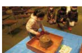
昨年度の特別体験学習(昔の道具体験)の様子/県立博物館