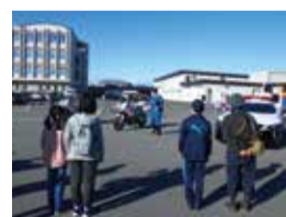
おまわりさん体験講座/県警察本部