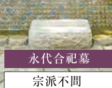
永代合祀墓 宗派不問