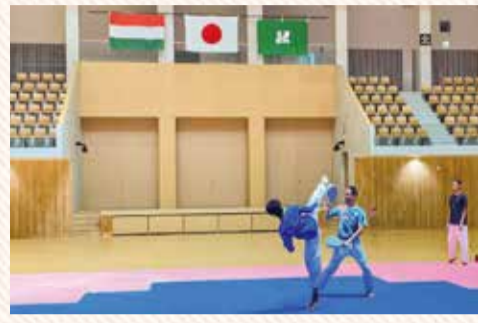
ユウケイ武道館で練習するテコンドー選手団

ホストタウンをご存じですか？これは、東京2020大会に参加する国・地域と、スポーツや文化、経済などで相互交流することにより、地域の活性化等を推進するとともに、同大会後も継続的に交流していくことを目的としています。