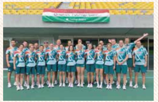
カンセキスタジアムとちぎで練習する陸上競技選手団

本県は、2015年の世界陸上北京大会での陸上競技選手団受け入れを縁に、東京2020大会におけるハンガリーのホストタウンとして登録されています。