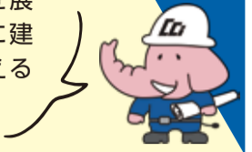
タイトル背景写真