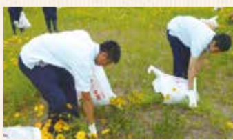
特定外来種植物の駆除(宇都宮白楊高校)

県立高校では、「総合的な探求の時間」や「課題研究」等を利用し、身近なところから取り組む学習を行うことにより、SDGsが掲げる地球規模の課題を生徒が自らの問題として捉え、課題の解決に向けた意識や主体的に取り組む姿勢を育んでいます。