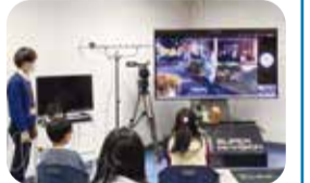
テレビってなんで映るの?/NHK宇都宮放送局