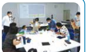
身近なところに生石灰は使われています。/吉澤石灰工業株式会社