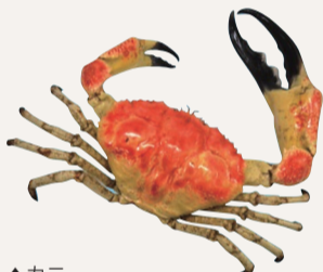
▲カニ (オーストラリアオオガニ)

本展では、県内に生息する甲殻類をはじめ、多種多様な甲殻類の世界とその暮らしぶり、そして、食や文化を通じた人と甲殻類との関わりについて紹介します。