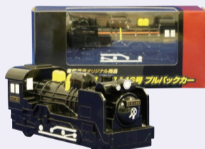
▲真岡鉄道D51プルバックカー

「野岩鉄道会津鬼怒川線全線フリーきっぷ乗車券」「真岡鉄道D51プルバックカー」「わたらせ渓谷鐵道一日フリーきっぷ引換券」をそれぞれ2名の方にプレゼント!