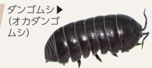
▲ダンゴムシ (オカダンゴムシ)