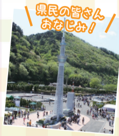
県民の皆さんおなじみ!