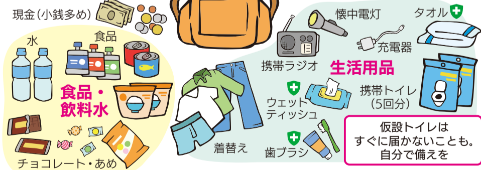
※イラストは1人1日分の量の目安です(1~3日分を準備しましょう)