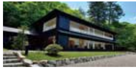
▲英国大使館別荘記念公園