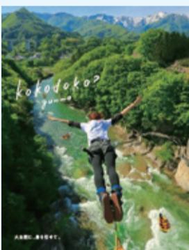
バンジージャンプ(みなかみ町)