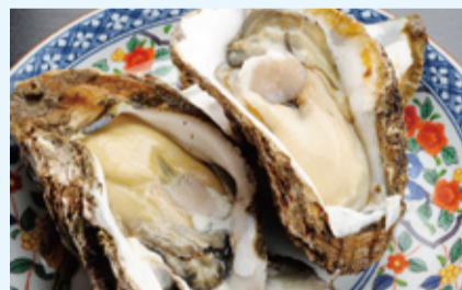
身が厚くクリーミーな味わいの岩ガキ