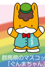
群馬県のマスコット「ぐんまちゃん」