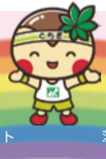
茨城県のマスコット「ハッスル黄門」

栃木、茨城、群馬の3県は、北関東自動車道でダイレクトに結ばれています。今年の夏は、お隣の県にも出掛けてみませんか。