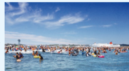
毎年大にぎわいの大洗サンビーチ海水浴場

茨城県内最大の「大洗サンビーチ海水浴場(大洗町)」は、宇都宮から北関東自動車道で約1時間とアクセス良好です。他にも、波が穏やかで家族連れに人気の「平磯海水浴場(ひたちなか市)」や、サーフィンに最適な「波崎海水浴場(神栖市)」など、バラエティ豊かな海水浴場がそろっているのが茨城県の魅力です。さらに、海上花火大会や夜の海を舞台としたイベントなど、一日を通して、いばらきの海を満喫できます。