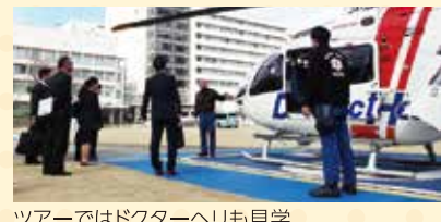
ツアーではドクターヘリも見学

医学生が、将来栃木県内に勤務するきっかけとなるよう、県内の臨床研修病院を見学するバスツアーを開催しています。