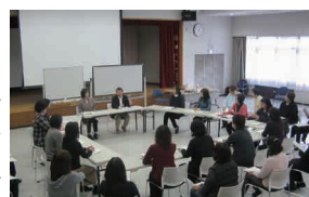
情報支援スタッフの養成

2022年の全国障害者スポーツ大会に向け、手話・要約筆記を行う情報支援スタッフの養成等を行うとともに、強化指定選手制度などによる選手の育成・強化に取り組めます。