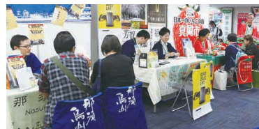
オールとちぎ移住相談会

国の「わくわく地方生活実現政策パッケージ」を活用し、東京圏からの移住・就業および県内女性・高齢者などの新規就業を促進します。