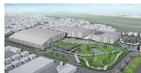
新体育館・屋内水泳場

2022年の国民体育大会・全国障害者スポーツ大会の本県開催に向け、新スタジアム、新体育館・屋内水泳場等の運動施設、公園・園路の整備などを行います。