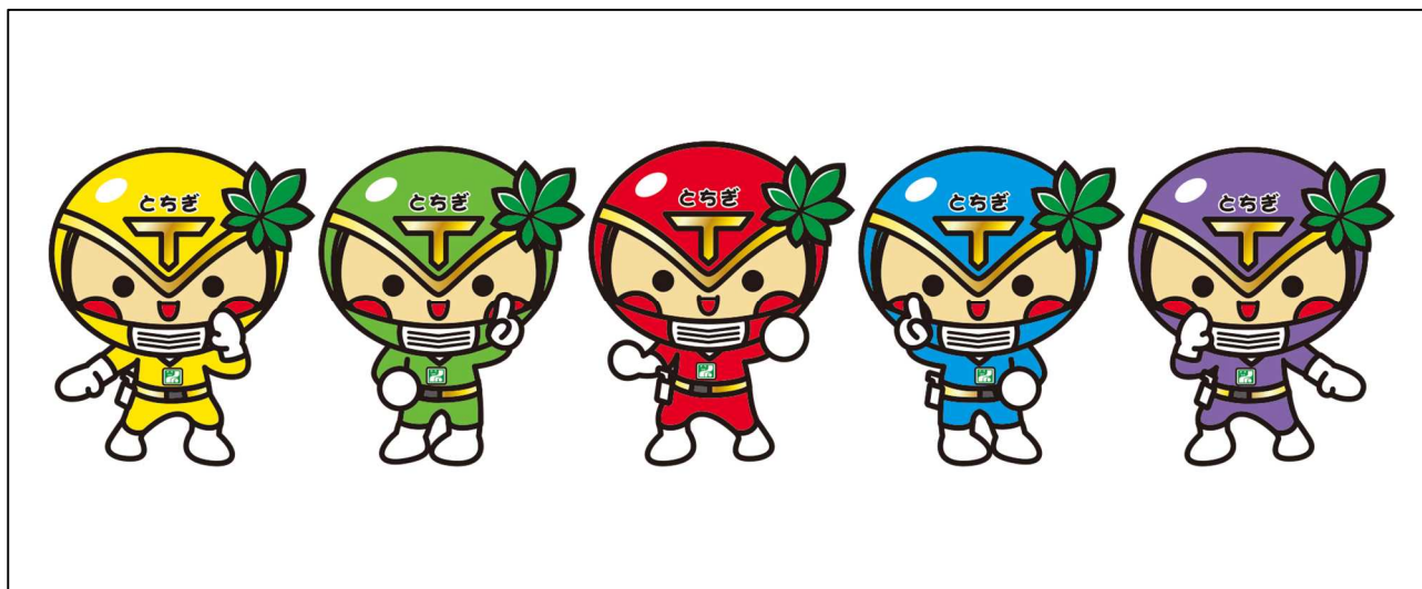
No. 2 とちぎの元気な子ども育て隊!! (のぼり旗有り)